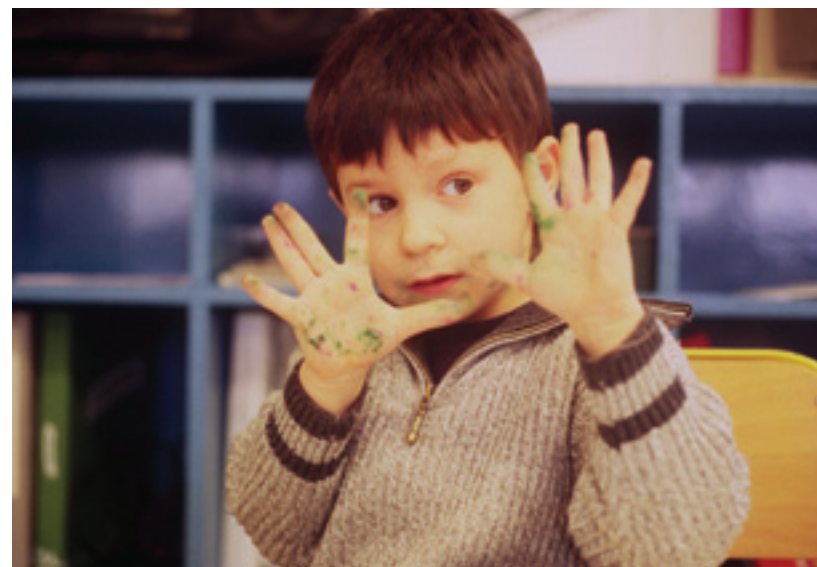
A fi și a avea

Cel mai recent film al lui Philibert, Casa radio , ilustrează o întregă lume nevăzută dincolo de microfoanele radioului național care aduce francezilor în fiecare zi știrile din jurul lumii, teatre radiofonice, interviuri ori muzici improvizabile și franțuze cu elastice și ventilatoare. Doamna care preia știrile și se amuză că, iată, sunt acum patru cadavre pierdute, nu trei, doamna care muștruluiește tineretul nou-venit în lumea radiofonică, domnul care e îngropat în CD-uri cu muzică clasică de abia i se mai vede capul peste ele, domnul care vorbește despre importanța cartofilor pentru