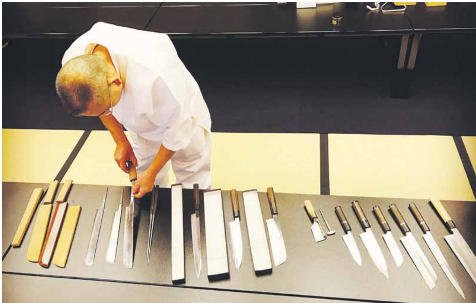
Totul despre stelele Michelin

Plasat de asemenea în haute couture-ul culinar, Misiunea lui Alain Ducasse îl surprinde pe Ducasse, un guru al bucătăriei internaționale – proprietarul unor restaurante care însumează 18 stele Michelin. Este un om realizat, dar care muncește fără încetare, în căutarea gustului desăvârșit. Pasiunea îl ține în priză, iar exigența lui atinge cote greu de atins. Cu toate că a făcut o industrie din propria muncă, el pare la fel de bucurat ca în prima zi. Gătește pentru înalți demnitari, pentru multimilionari, gândește mese pentru sute de oameni, dar tot mai bine se simte în natură, unde rodesc preparatele de mâine. El e dovada vie că, orice ai alege să faci în viață, ai succes