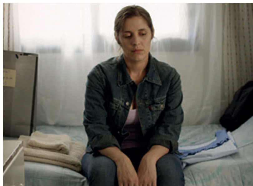
A Decent Woman

Virgil Widrich's second feature, Night of 1000 Hours , is a fantasy mystery film, with touches of black comedy. In the Ullich fami-