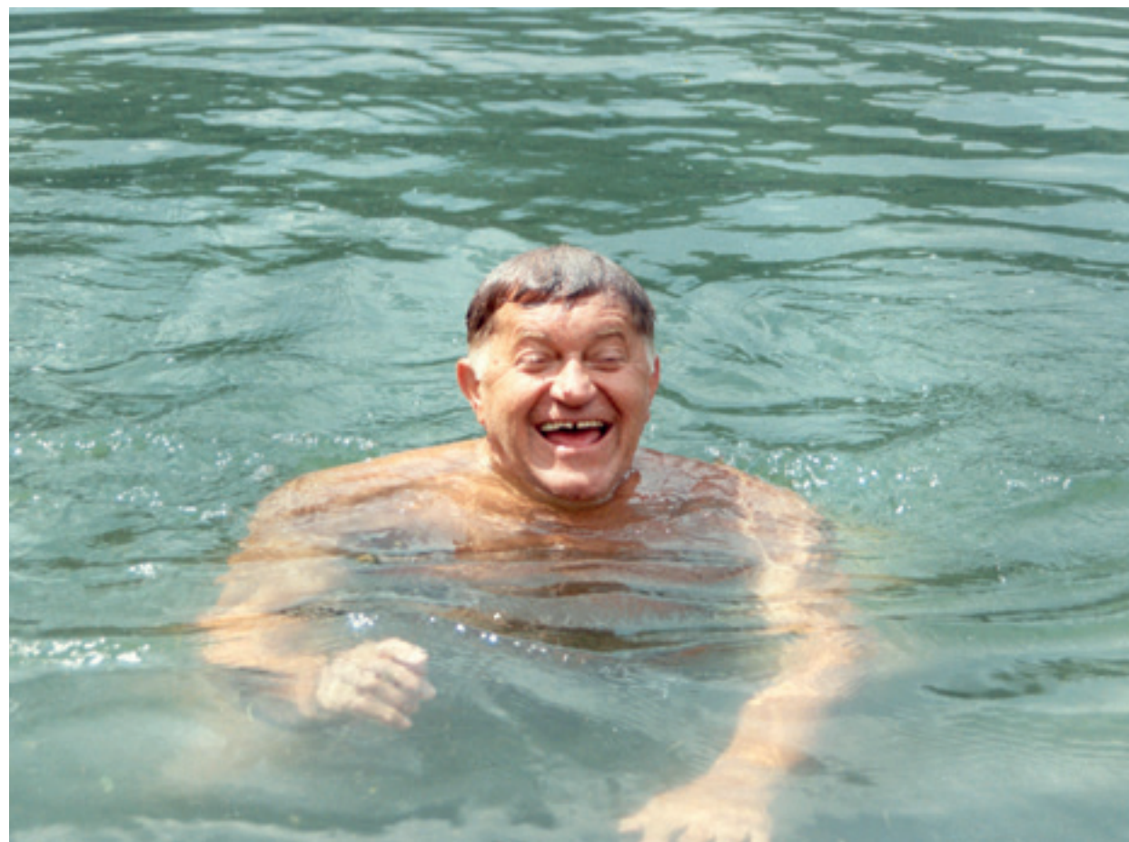
The Snails' Senator

Do not miss the screening of Microphone Test today, at 19:30, at Cinema Florin Piersic , in the presence of director Mircea Daneliuc.