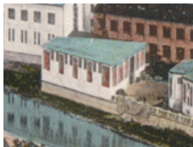
Studiourile de film ale lui Janovics Jenő

Lângă Someș, sub dealul Cetățuții, în apropierea vechilor ziduri alele cetății medievale, s-a construit la începutul secolului trecut o adevărată cetate a cinematografului, plasând pentru scurt timp Clujul la vârful unei noi industrii europene.