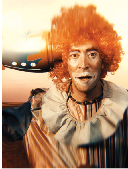
Viață de clown