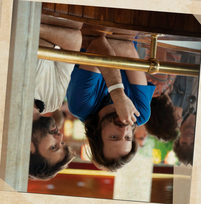
Ce planuri au în acest sezon Steve (Joe Keery), Robin (Maya Hawke) și Nancy (Natalia Dyer), care se află în Hawkins?