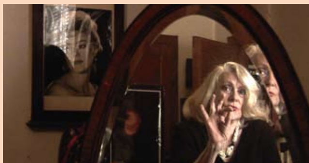
Intimidades de Shakespeare y Victor Hugo