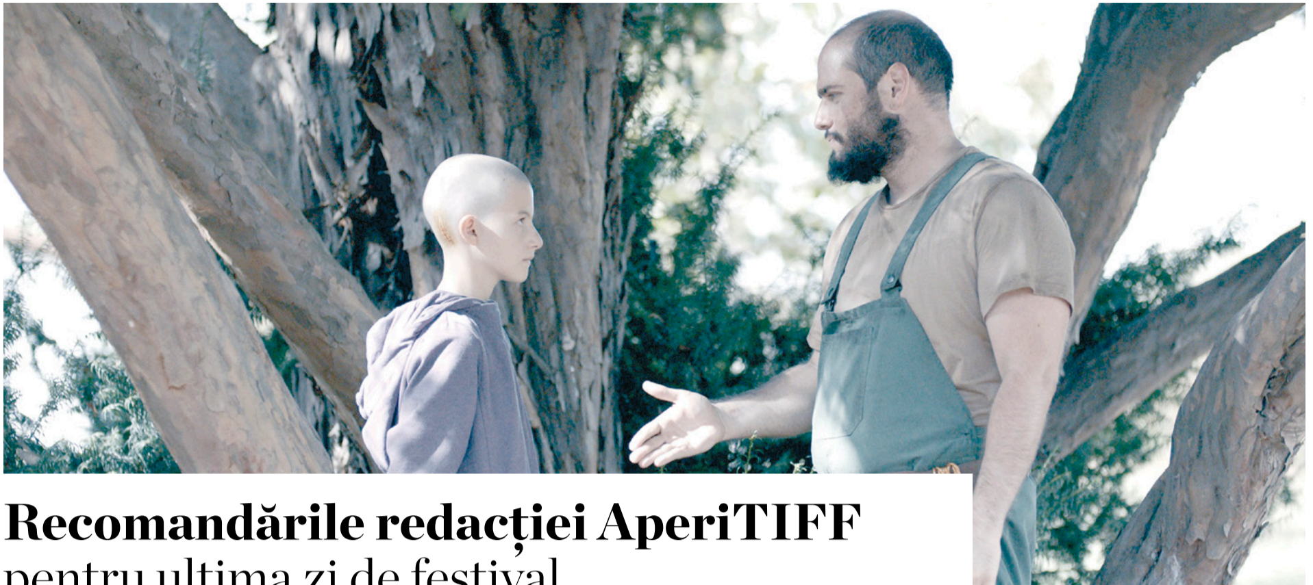
Copacul Dorințelor: Amintiri din Copilărie