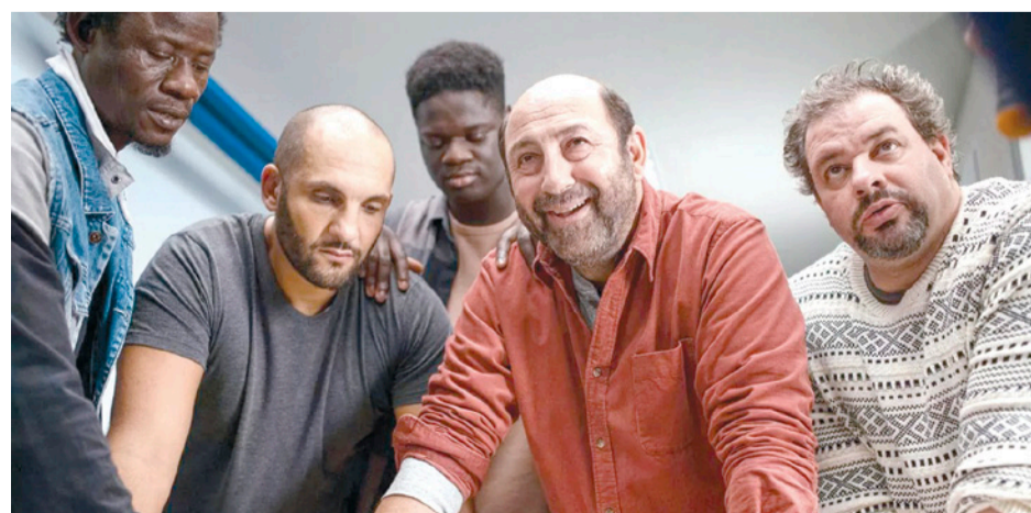
Succes de public

Misterul flamingoului roz este filmul care m-a lovit cel mai tare anul acesta. Filmul combină cel puțin 5 genuri diferite: dramă, comedie, parodie, podcast, animație, toate într-o coloratură stridentă, kitsch și al naibii de plăcută privitorilor. Da, există o mega comercializare a ideii de pace și liniște și relaxare, subliniată prin imaginea flamingoului roz, devenită