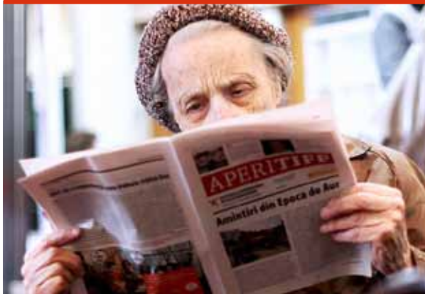
Amintiri din Epoca de Aur