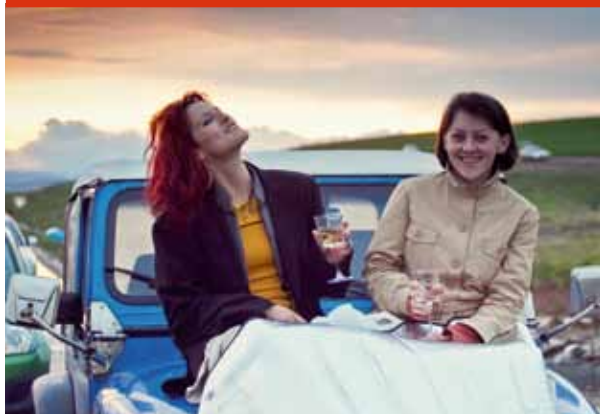
Vin la drive in