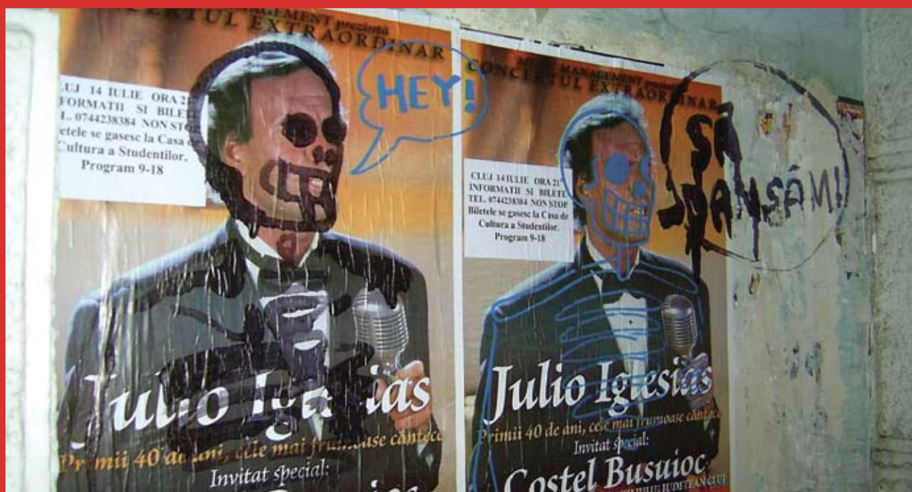
Un viitor rockumentar la TIFF?