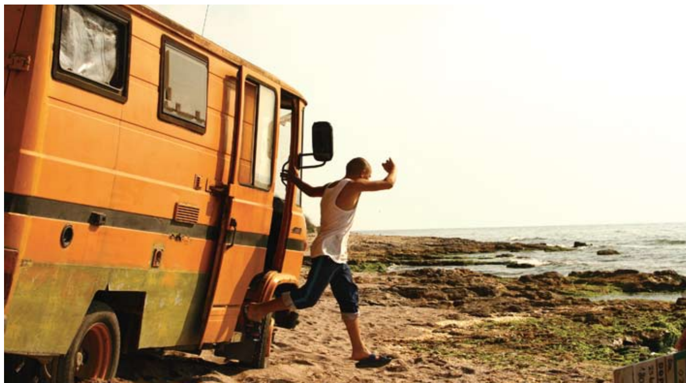
A Good Day for a Swim

The founding father of the Transilvania International Film Festival, Romanian Film Promotion launches Romanian films at foreign showcases and encourages foreign producers to shoot in Romania.