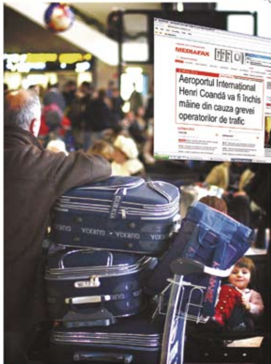
A Peste 80% din știrile din presa de azi au fost publicate de ieri de Mediafax. Intră acum pe www.mediafax.ro ca să citești presa de mâine. Află primul!