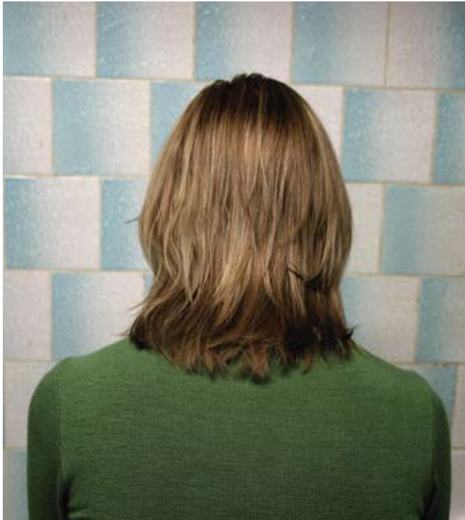
4 Months, 3 Weeks and 2 Days

in Brașov, which will take place in summer – a showcase for horror films in a medieval city related to Count Dracula.”