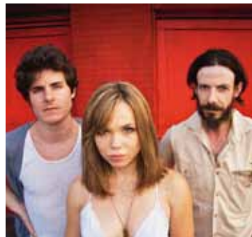
Red, White and Blue