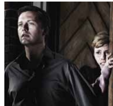
Deliver us from Evil

Secțiune de umbre mi-a fost simpatică în mod constant și cum să nu am foarte aproape de inimă antidoturile veninoase, cu psihoze, monștri, alieni și revărsări de mațe, cînd tocmai dubioșeniile aparent slectate și calibrate doar pentru “iubitorii genului” pot furniza revelații festivaliere și pot ori-cînd splăla din cutia craniană de spectator de plictisuri, iritări sau frustrări. A doua zi a cinema-ului nostru drag, premiat și realist este și ziua Umbrelor . Pentru că după ce au parazitat împrăștiate înaintea filmelor din competiție mare parte din festival, scurtmetrajele mai mult sau mai puțin horrorifice se grupează în două calupuri.