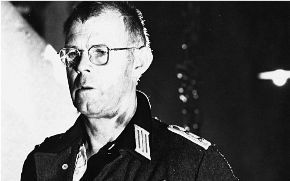
Forme de eliberare