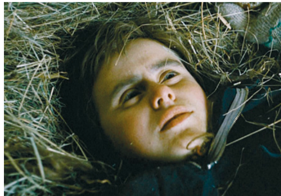
Pământul e un cântec păcătos

Focusul nordic cuprinde, pe lângă titluri noi, și câte un titlu clasic, emblematic nu doar pentru cinematografia fiecărei țări în parte, dar și pentru modul în care se simte în peisajul cinematografic de astăzi