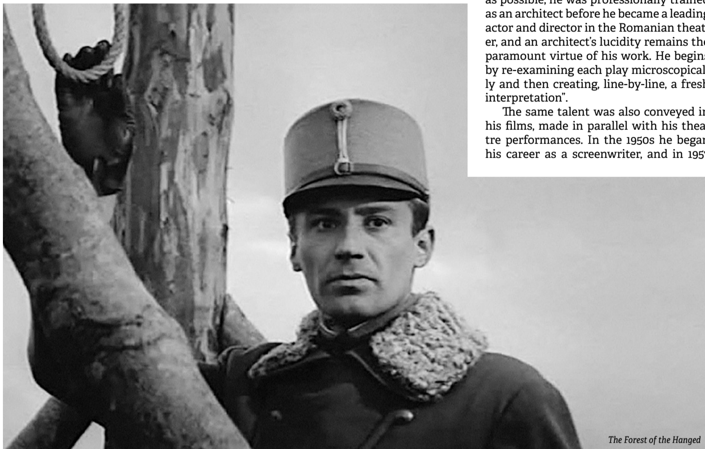
The Forest of the Hanged

Born 100 years ago on July 7, the multidisciplinary Liviu Ciulei, who would be called by Newsweek “one of the boldest and most challenging figures on the international scene”, directed theatre and film, was an actor, writer and architect, and created film sets and costumes.