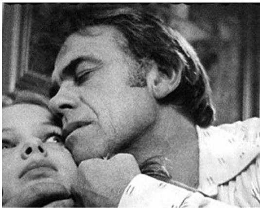
Povestea unei crime

În una dintre primele secvențe ale filmului, un bărbat scoate vițelul din vacă pe bucăți. bagă mâna înăuntru și-l taie di-