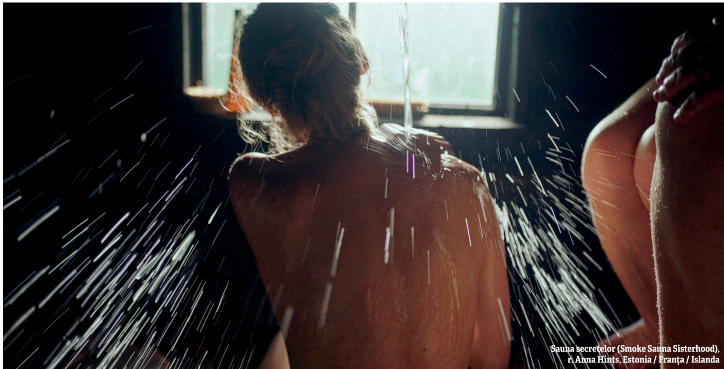
Sauna secretelor (Smoke Sauna Sisterhood), r. Anna Hints, Estonia / Franța / Islanda